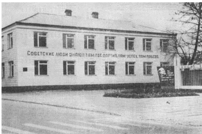
Чернобыльская районная типография

Моя дочь с детьми к этому времени с подругой и ее ребенком уже уехали к каким-то родственникам подруги. До середины мая я не знала, где она находится. Муж (тоже, к сожалению, уже покойный) эвакуировался без меня. С 26 апреля дома я не появлялась.