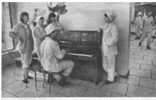
Пуца Водица. Реабилитационный центр