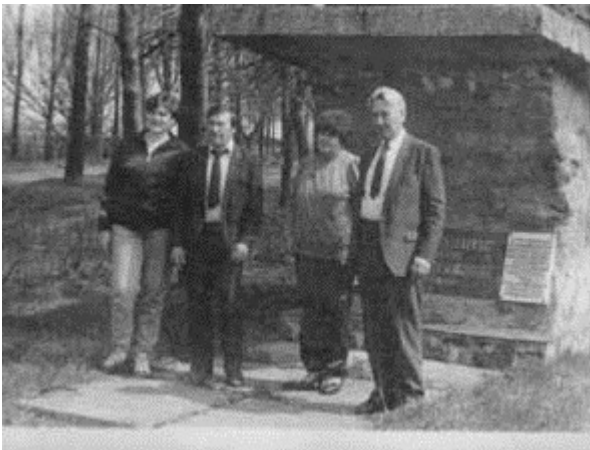
Встреча друзей возле Памятного знака воинам-освободителям Чернобыльского района