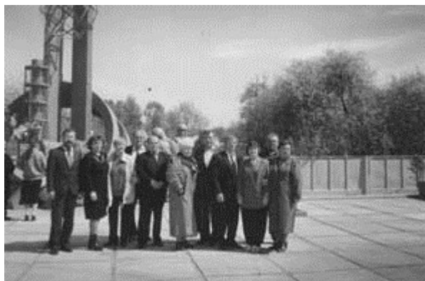
У памятника пожарным