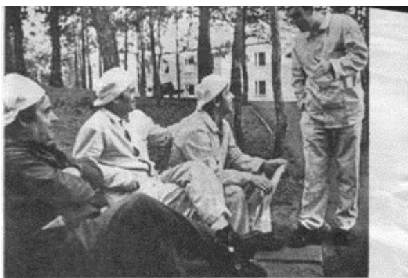
Пуща Водица. Реабилитационный центр

Давно очень точно подмечено, что человек познается в беде. Хочу просто сравнить двух руководителей Правительственной комиссии Ивана Степановича Силаева и Льва Андреевича Воронина. Я уже говорила, что в первые недели после эвакуации Чернобыля у нас не было технических работников, не работали столовые и ресторан. Девушку-парикмахера привезли к нам, когда уже просто необходимо было постричься. И жару, и другие бытовые проблемы И.С.Силаеву приходилось переносить наравне со всеми другими. И никто не роптал, ничего не требовал. У нас на это просто не было времени.