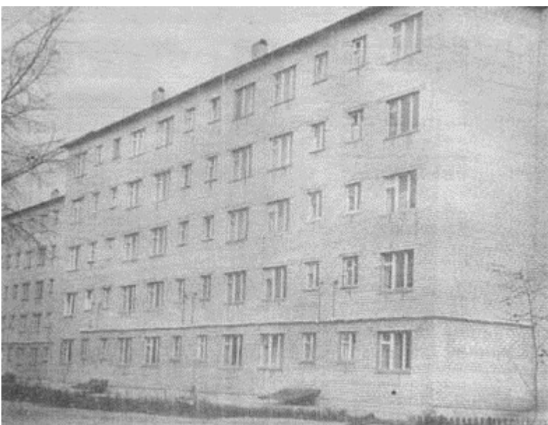
Стоквартирный жилой дом