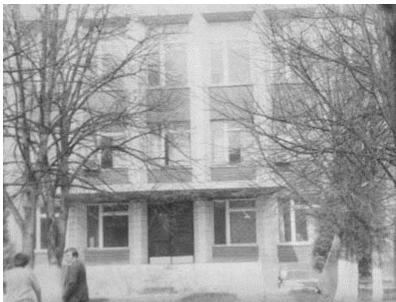
Здание Чернобыльского райисполкома