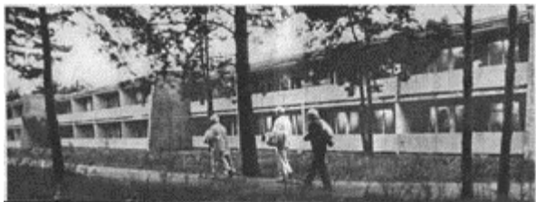
Пуща Водица. Реабилитационный центр

А сколько сотен работников различных служб и СМИ прошло через приемную Правительственной комиссии и не сосчитать.