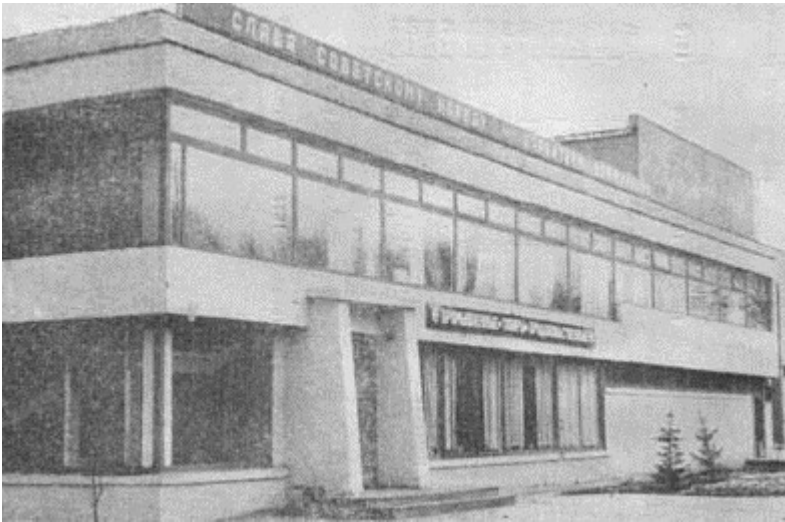
Хозрасчетный магазин ОРСа ЧССРЗ